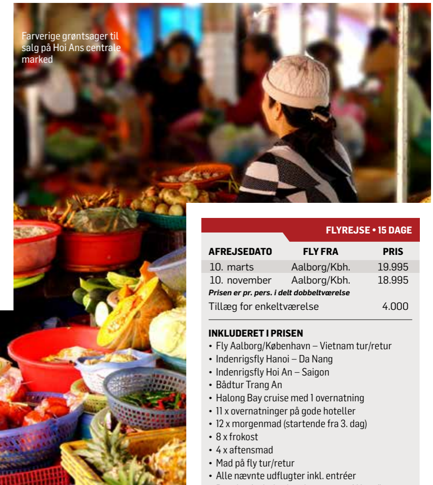
Farverige grøntsager til salg på Hoi An's centrale marked